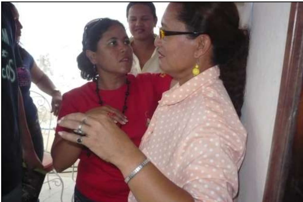
Demostración a la comunidad sobre evaluación antropométrica.