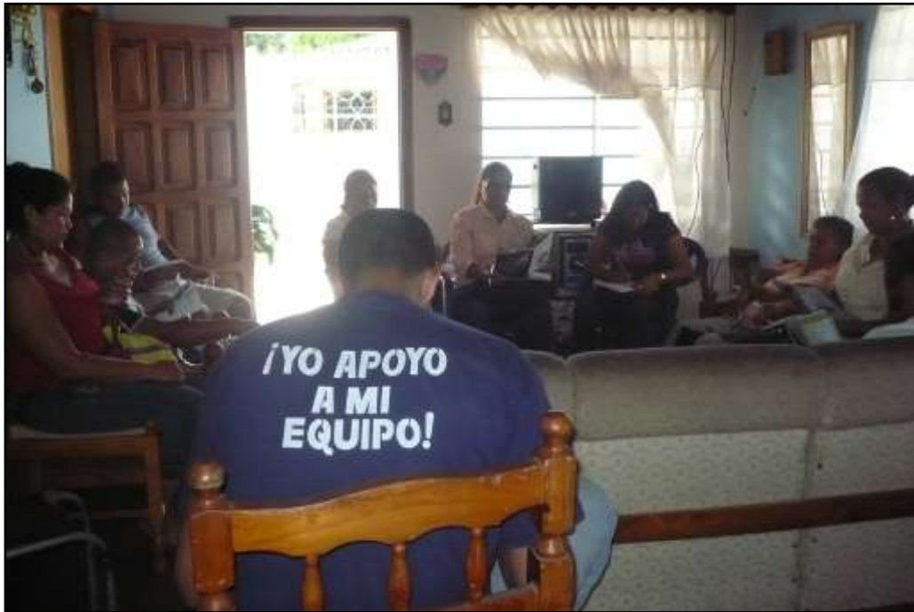
Interacción con los Concejos Comunales.